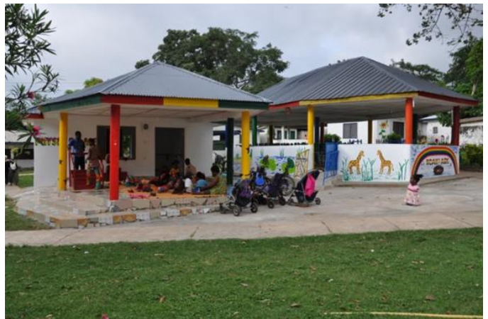
Physio Palace en Noah's Ark

In oktober hebben wij met veel plezier en in grote dankbaarheid officieel het nieuwe centrum van de Community, bestaande uit drie prachtige gebouwen nl. Royal Community Hall, Noah's Ark en Physio Palace, feestelijk geopend. Noah's Ark is compleet met fraaie muurschilderingen en wordt inmiddels al intensief gebruikt. Datzelfde geldt voor het mooie en functionele Physio Palace, waarmee wij zowel binnen als buiten veel ruimte en mogelijkheden voor fysio-oefeningen hebben gekregen.